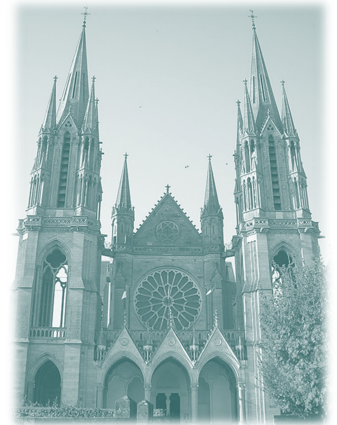
SANCTUAIRE DE NOTRE DAME DU PONTMAIN