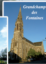
Grandchamp des Fontaines