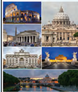
Paroisse St Jean d'Erdre et Gesvres

Inscriptions : coupon réponse à récupérer dans chaque église/presbytère