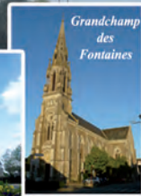
Grandchamp des Fontaines